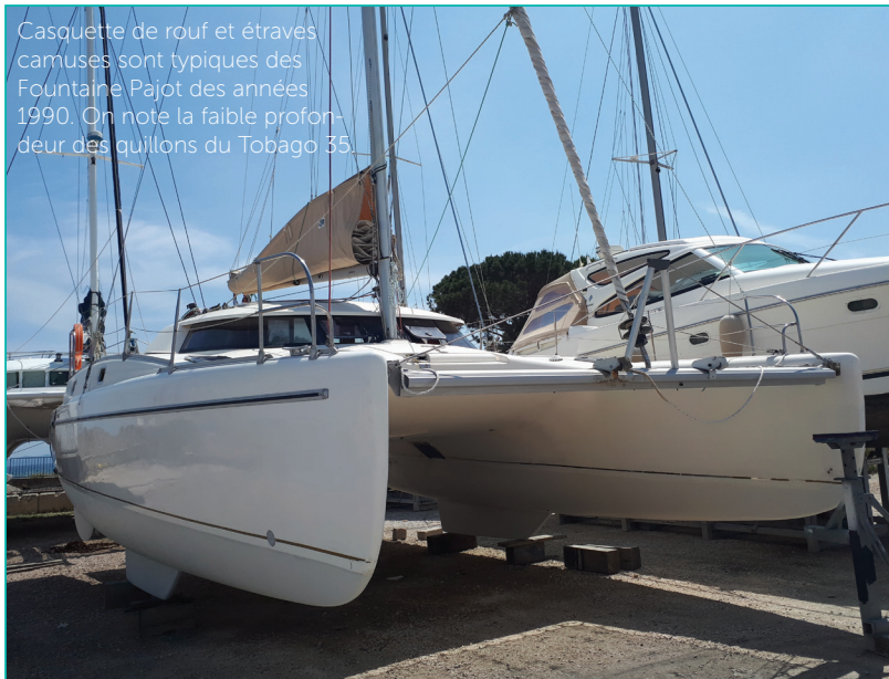
Casquette de rouf et étraves camusées sont typiques des Fountaine Pajot des années 1990. On note la faible profondeur des quillons du Tobago 35.

Produit à moins de 100 exemplaires pendant les années 1990, le Tobago 35 n'a pas connu la diffusion plus large des modèles de la décennie suivante. Ce qui n'empêche pas ce catamaran compact d'être une excellente opportunité pour les budgets serrés.